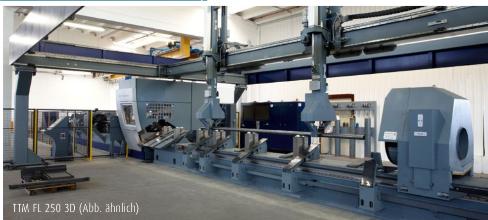
TTM FL 250 3D (Abb. ähnlich)